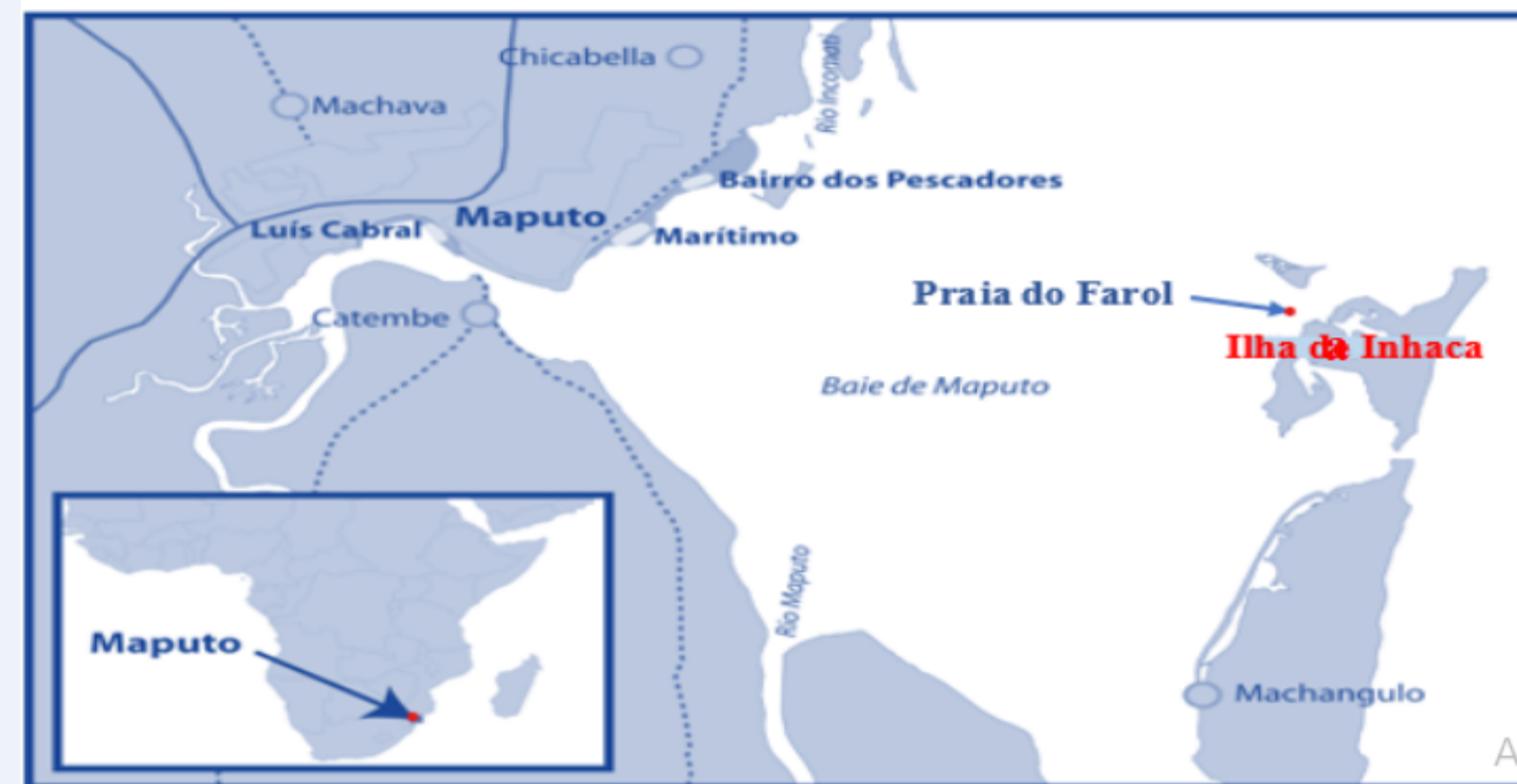
Figura 1: Localização geográfica da Praia do Farol.

As amostras de macroalgas foram colhidas na Praia do Farol, por conveniência. E o estudo foi realizado no Departamento de Ciências Biológicas, Faculdade de medicina e Departamento de Química, UEM.